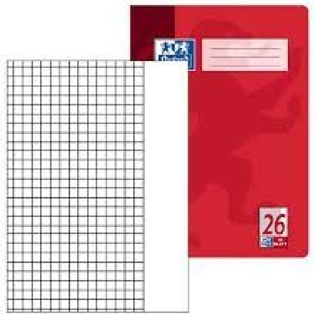
Quadratische Kästchen und Rand!