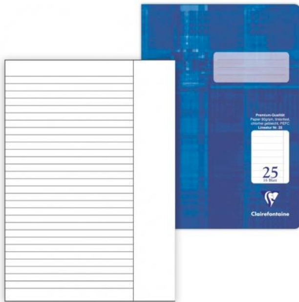
Linienabstand 1 cm und Rand!